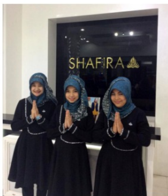
高級ブランドの「シャフィラ」