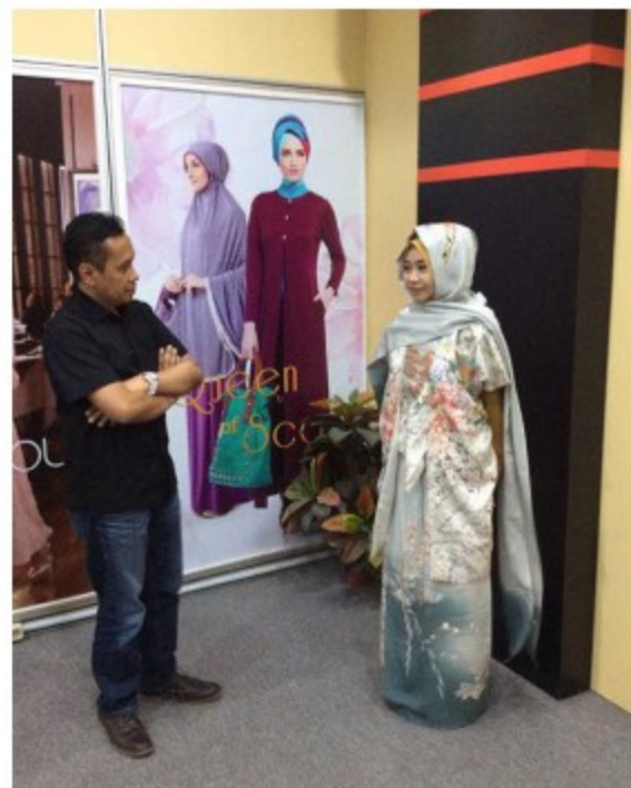
フェイスブックで反響が大きかった写真