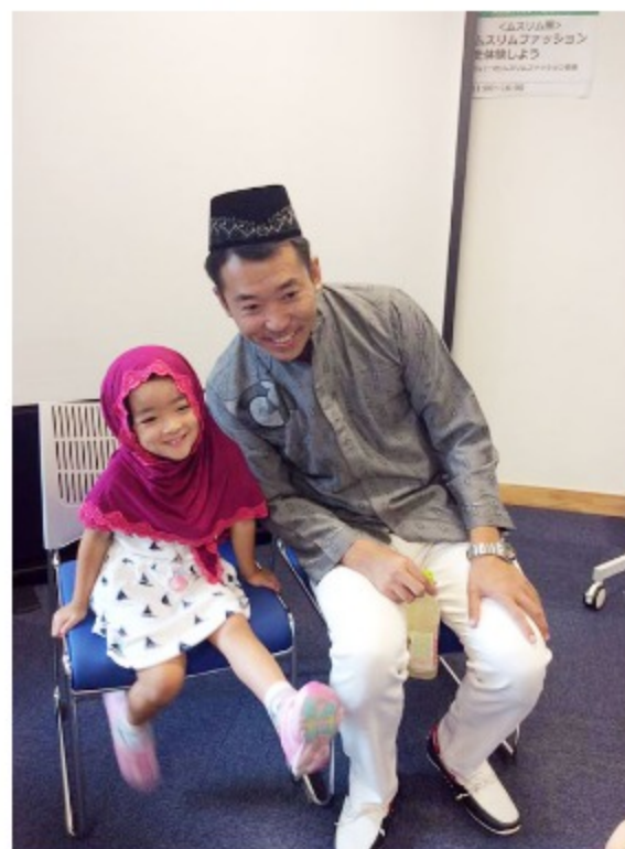
プラザ神明フェスティバルのブースでムスリム服を体験する人